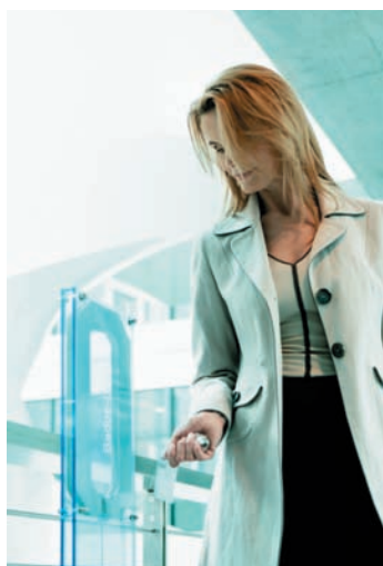
Kaba CardLink™ verbindet die Standalone- mit der Online-Welt der Zutrittskontrolle

Mit der neuen Technologie führt Kaba Online- und Standalone-Zutrittssysteme zusammen. Integrales Zutrittsmanagement wird für den Kunden Realität, unabhängig davon, ob die Systemperipherie verdrahtet (online) oder nicht verdrahtet (Standalone) im Gebäude installiert wird.